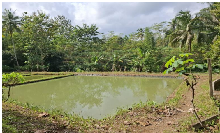
Gambar 3. Kolam Ikan

Desa Luwung, Kecamatan Rakit, Kabupaten Banjarnegara memiliki potensi yang dapat dikembangkan untuk meningkatkan kesejahteraan masyarakatnya. Potensi utama Desa Luwung adalah di bidang perikanan. Desa ini memiliki sumber air yang melimpah yang dapat dimanfaatkan untuk budidaya ikan tawar seperti ikan mujair, tawes, gurame, lele, dan nila. Budidaya ikan ini dapat dilakukan di kolam ikan yang tersebar di berbagai tempat di desa, memanfaatkan sumber daya yang ada. Sebagian besar masyarakat Desa Luwung bermata pencaharian sebagai petani ikan. Selain budidaya ikan, hasil perikanan di Desa Luwung juga dapat diolah menjadi produk bernilai tambah seperti keripik ikan, abon ikan, atau dijual dalam bentuk utuh ke rumah makan dan pasar tradisional. Pengolahan ini tidak hanya meningkatkan nilai jual produk tetapi juga membuka lapangan pekerjaan baru bagi masyarakat sekitar, khususnya bagi para ibu rumah tangga dan pemuda desa.