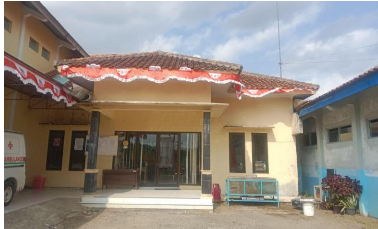
Gambar 4. Kantor Balai desa Luwung

Balai Desa Luwung berfungsi sebagai kantor desa dan pusat kegiatan warga. Balai desa ini menyediakan berbagai layanan administrasi kependudukan untuk masyarakat, seperti perizinan pendidikan, kesehatan, surat keterangan, pertanahan, dan pindah domisili, sesuai dengan kewenangan daerah. Secara lebih rinci, kantor desa di Kabupaten Banjarnegara ini melayani pengurusan dokumen seperti surat keterangan domisili, Surat Kelakuan Baik, Surat Pindah Keluar, Surat Keterangan Tidak Mampu, Surat Keterangan Usaha, Surat Usaha Mikro, Surat Pernyataan Miskin, surat domisili sementara, dan dokumen lainnya. Selain itu, Balai Desa Luwung juga menjadi tempat untuk berbagai kegiatan warga seperti musyawarah, rapat desa, penyuluhan, lomba, dan lain-lain.