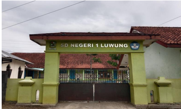
Gambar 8. SDN 1 Luwung