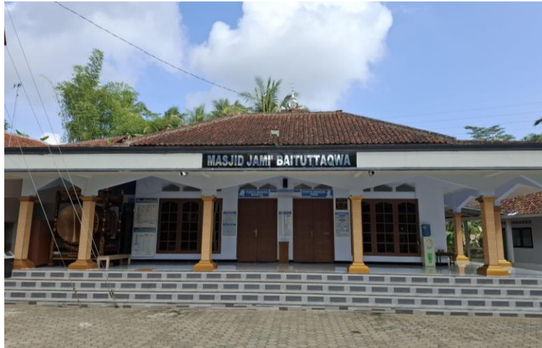
Gambar 11. Masjid Baituttaqwa

di desa ini, terletak di rt 03 rw 02 Masjid-masjid ini tidak hanya digunakan untuk salat berjamaah, tetapi juga untuk berbagai kegiatan keagamaan seperti pengajian, perayaan hari besar Islam, dan acara sosial lainnya.