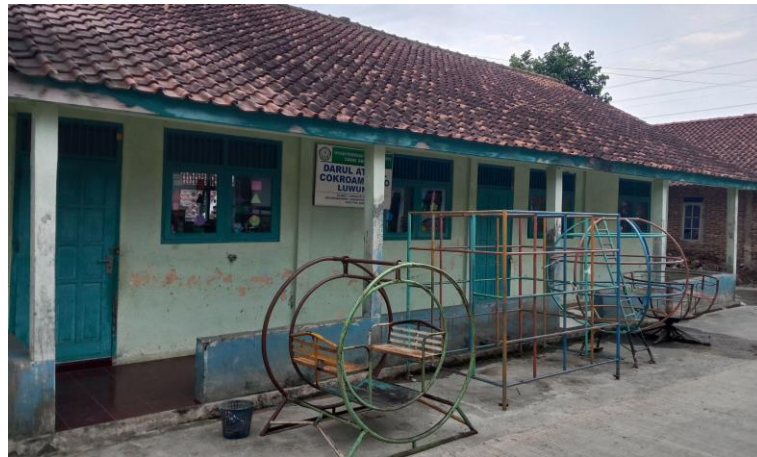
Gambar 7. Darul Athfal Cokroaminoto

dan kerajinan. Perbedaan utama antara DA dan TK terletak pada pendekatan kurikulum dan fokus pendidikannya. DA (Darul Athfal) adalah jenis pendidikan prasekolah yang lebih menekankan pada pendidikan agama Islam. Di RA, anak-anak juga belajar tentang nilai-nilai moral, doa, praktik ibadah, dan cerita-cerita religius.