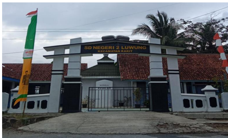
Gambar 9. SDN 2 Luwung

SDN 2 Luwung didirikan pada tahun 1978 yang terletak di Desa Luwung Rt 01 Rw 02 Kecamatan Rakit Kabupaten Banjarnegara. Fasilitas yang disediakan oleh SDN 2 Luwung antara lain ruang kelas yang bersih dan nyaman dengan perlengkapan belajar yang memadai, serta perpustakaan dengan koleksi buku yang mendukung literasi siswa.