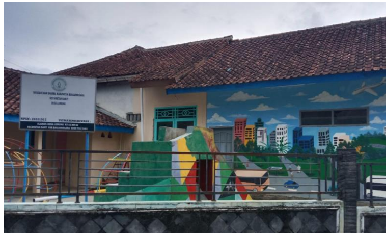
Gambar 5. TK Pertiwi 1 Luwung

Selain itu, mereka juga mengadakan kegiatan luar ruangan dan bermain kelompok untuk mengembangkan keterampilan sosial dan emosional anak-anak. TK Pertiwi memainkan peran penting dalam pendidikan anak usia dini di Desa Luwung, membantu mempersiapkan mereka untuk jenjang pendidikan dasar, dan melibatkan orang tua dalam proses pendidikan.