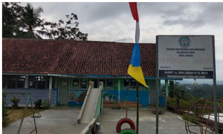
Gambar 6. TK Pertiwi 2 Luwung