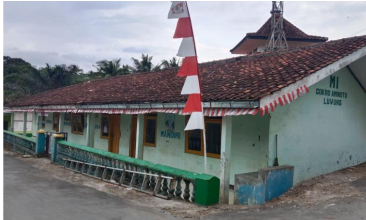
Gambar 10. MI Cokroaminoto Luwung

Selain kegiatan belajar di kelas, MI Cokroaminoto mengadakan kegiatan ekstrakurikuler seperti olahraga, seni, dan kegiatan keagamaan. MI Cokroaminoto berperan penting dalam membentuk generasi muda Desa Luwung yang cerdas dan berakhlak mulia.