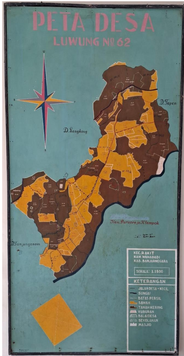
Gambar 2. Peta Desa Luwung

Desa Luwung terletak di Kecamatan Rakit, Kabupaten Banjarnegara dengan ketinggian sekitar 300 hingga 600 meter di atas permukaan laut (mdpl).